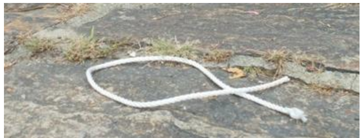
Christussymbol (= Fisch)

Lieber Gott, mache unsere Gemeinde zu einem Ort des Zuspruchs, wo viele die Freude des Evangeliums leben und Kirche offen für alle ist.